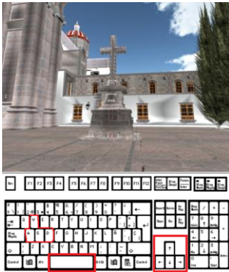
Anexo 7: Recorrido Virtual con la ayuda del teclado.