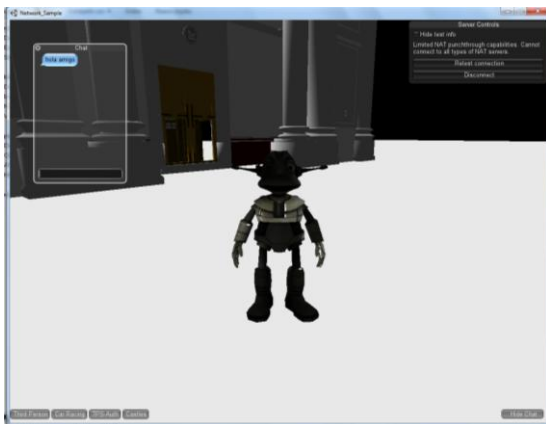
Anexo 9: Aplicación en red mostrando un avatar dentro del mundo virtual de Catedral.