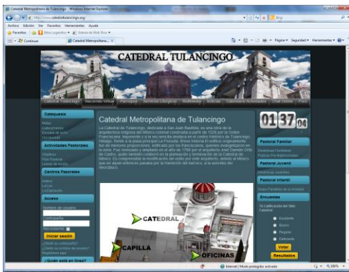
Anexo 8. Vista de la página principal de Catedral.