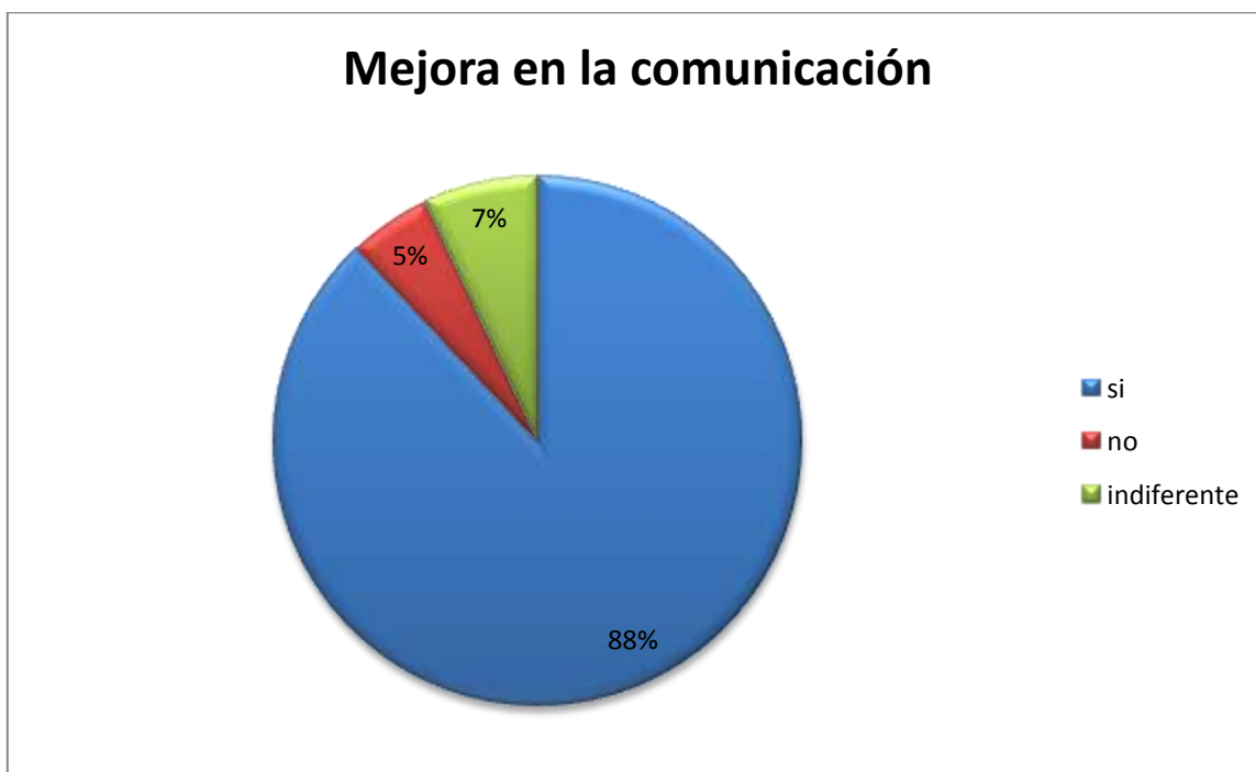
Gráfica 4. Mejora en la comunicación

Con referente la comunicación, el 88% de los estudiantes consideraron que si mejoraron, debido a que exponían dudas, preguntas, comentarios, respecto a las tareas, a los temas o actividades que realizaban no sólo con el maestro responsable del grupo de Facebook, sino también con maestros que todavía no cuenta con la aplicación o que la quieren mantener personales y no proporcionárselas a los alumnos.