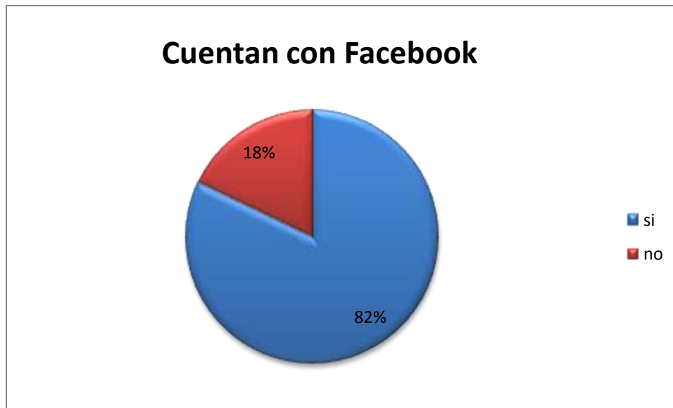
Gráfica 3. Estudiantes con Facebook

El 100% de nuestros estudiantes posee una cuenta de correo electrónico, utilizando generalmente en las horas que se encuentran en la Institución que les ofrece el Internet. Para el diseño del grupo en la página de inicio, en la parte inferior izquierda, aparece el área de Grupos, al posicionarse nos aparece la palabra MÁS , la cual nos lleva al menú de grupos, en crear un grupo nos permite dar los generales del grupo, tales como el nombre, el propósito y agregar a los miembros