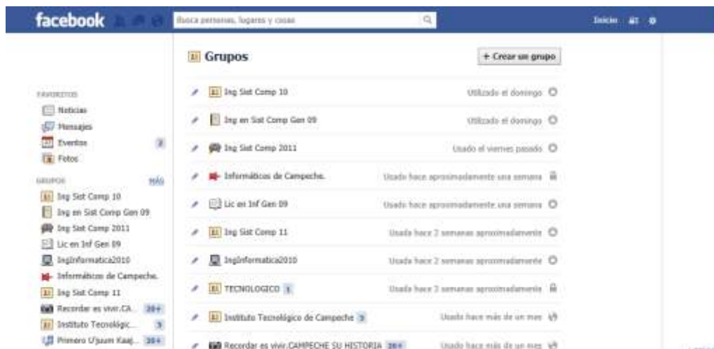
Figura 1. Área de Grupos en Facebook.

El 100% de nuestros estudiantes posee una cuenta de correo electrónico, utilizando generalmente en las horas que se encuentran en la Institución que les ofrece el Internet. Para el diseño del grupo en la página de inicio, en la parte inferior izquierda, aparece el área de Grupos, al posicionarse nos aparece la palabra MÁS , la cual nos lleva al menú de grupos, en crear un grupo nos permite dar los generales del grupo, tales como el nombre, el propósito y agregar a los miembros