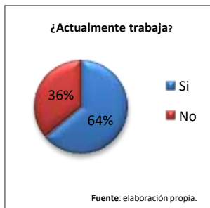
Fig 2. Distribución por alumnos que trabajan

Para ver cómo afecta o beneficia el hecho de que los alumnos tengan un empleo y al mismo tiempo estén cursando sus estudios se obtuvo partiendo de los datos obtenidos de la encuesta aplicada de donde se puede ver claramente el desempeño y rendimiento académico de los dos tipos de estudiantes, los que trabajan y los que no. obteniendo los resultados de los que trabajan el 4% tiene rendimiento muy bueno, el 43% tienen buen rendimiento y el 17% regular. De los encuestados que no trabajan el 6% alcanzaron el nivel muy buen, el 21% bueno y por último, el regular representado por 9%.