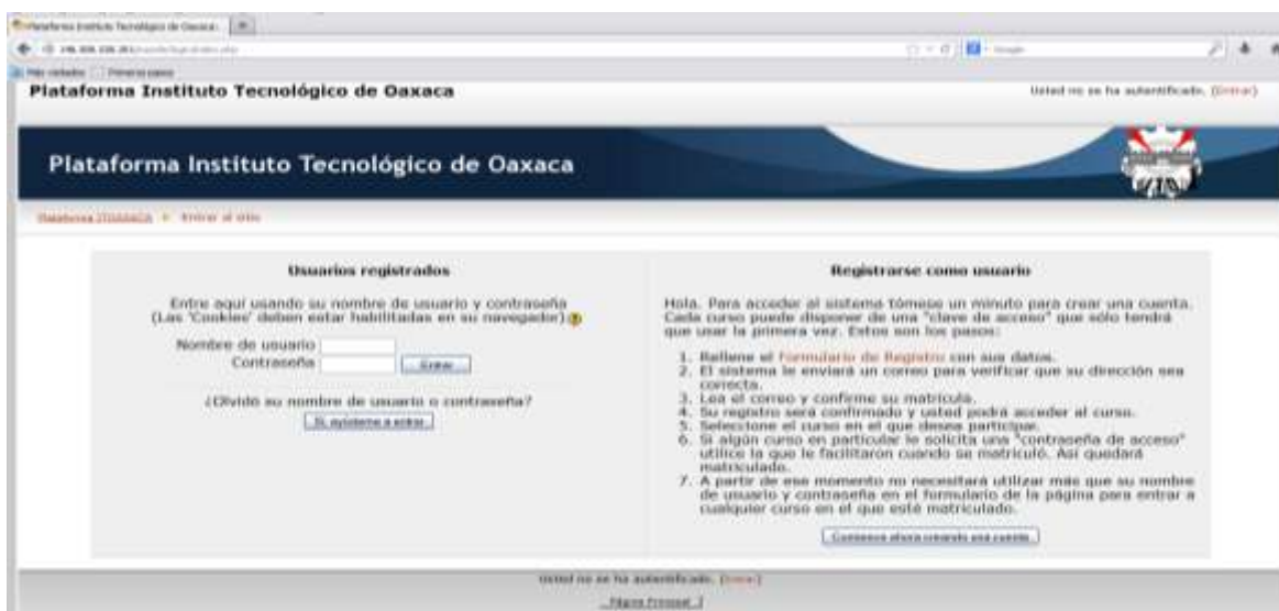
Fig. 1 pantalla inicial para acceder a la plataforma

Lo primero que tenemos que hacer como docentes es contar con una cuenta de usuario y contraseña, el responsable de la plataforma debe cerciorarse que el curso que se desea impartir esté dado de alta en la plataforma en la carrera y semestre que le corresponda asignándosela al docente que le corresponda, el cual recibe una clave de la materia.